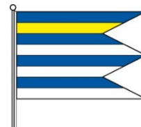
Obrázok 3 Vlajka obce

Vlajka obce Tušice pozostáva z ôsmich pozdĺžnych pruhov vo farbách 1/8 modrá, 1/8 žltá, 1/8 modrá, 1/8 biela, 1/8 modrá, 1/8 biela, 1/8 modrá, 1/8 biela. Vlajka má pomer strán 2:3 a ukončená je troma cípmi, t.j. dvoma zástrihmi, siahajúcimi do tretiny jej listu.